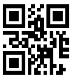
Contoh QR code

An. BUPATI/WALIKOTA/KEPALA PTSP KABUPATEN/KOTA ..... KEPALA LEMBAGA PENGELOLA DAN PENYELENGGARA OSS